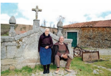
Altes Paar aus Portugal

Wie wird Auferstehung und ewiges Leben im Neuen Testament gesehen. Neu erscheint die Kombination von ewigem Leben durch das Halten der Gebote Gottes und Nachfolge Jesu (Lukas 10, 25 – 27; Matthäus 8, 22; Lukas 22). Der Glauben an Jesus Christus ist die Voraussetzung für das Leben (Römer 1, 17; Galater, 3, 11; Habakuk 2, 4; Johannes 11, 25 – 26; 1. Johannes 5, 11 – 13). Bei