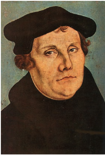
Martin Luther, Portrait von Lucas Cranach d.Ä., 1529

1517, das Jahr des (historisch nicht eindeutig belegten) Thesenanschlags Luthers an das Hauptportal der Wittenberger Schlosskirche, aber auf alle Fälle das Jahr des Beginns der Reformation und damit der Herausbildung evangelischer Kirchen. Luthers Aufruf galt, Missstände in der damaligen katholischen Kirche zu beseitigen. Die bis heute zu beklagende Kirchenspaltung war gewiss nicht seine Absicht, sondern ist der Tragik der damals handelnden, besser, nicht handelnden Personen geschuldet.