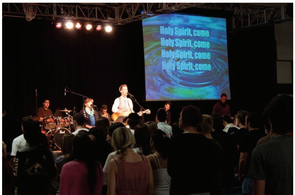
Studentengottesdienst an der California Baptist University mit der Lobpreisband, die christlichen Rock spielt