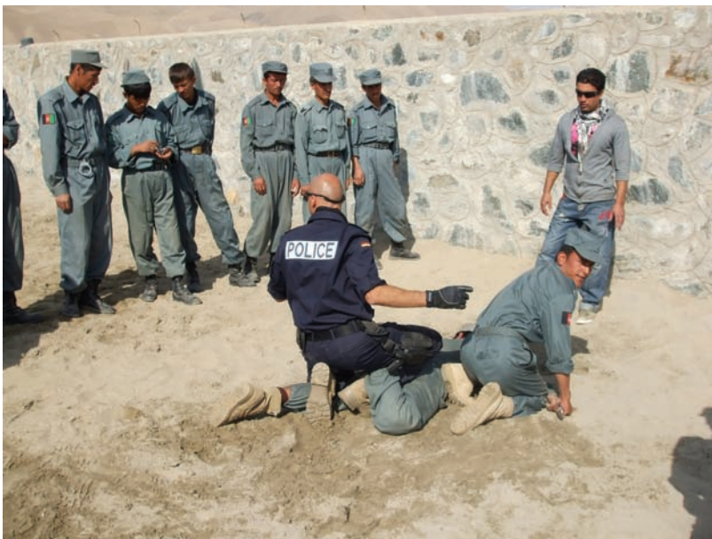
Training Trainingscenter Feyzabad

Das GPPT wird vom Leiter der Mission aus Kabul geführt. In Kabul selbst gibt es neben dem Führungsstab Beamte, die in der afghanischen Hauptstadt Projekte initiieren