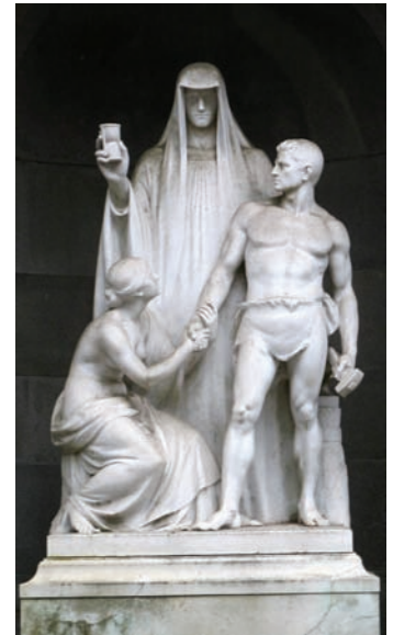
Allegorische Darstellung des Todes - Grabmal auf dem Nordfriedhof Wiesbaden

lie. Der Staat hatte keine Möglichkeit, da hineinzureden. Die Stationen des Aufstieges (Cursus honorum) waren an das Lebensalter gebunden. Cicero beschreibt das Alter als krönenden Abschluss des Lebens. Er schrieb ein Jahr vor seinem Tode an Cato den Älteren: „Jetzt ist Zeit, im Alter die Lebenszeit zu beschreiben, Zeit für alles jenseits der Politik“. Die Krone des Greisenalters aber ist das Ansehen. Das hohe Alter genießt, besonders wenn es Ehrenstellen bekleidet hat, ein Ansehen, das von größerem Wert ist als sinnliche Genüsse. Das waren einige Aussagen von Cicero. Ein Novum in der Anthropologie war die Deifizierung einer historisch-politischen Persönlichkeit in der europäischen Antike erstmals 42 v. Chr. Für menschliche Defizite ist im öffentlichen Leben kein Platz mehr. Im römischen Prinzipatstaat seit 18. v. Chr. herrscht Altersdiskriminierung. Es herrscht eine Pflicht zur Ehe und zu Kindern vom 25. - 60. Lebensjahr für die Männer. Frauen unterliegen der gleichen Verpflichtung zwischen 20 - 50 Jahren. Bei Kinderlosigkeit ist Scheidung angesagt. Die Mindestaltersgrenzen werden aufgehoben (Questor ab einem Alter von 31 Jahren, Volkstribun 37, Prätor 40 und Konsul ab 43). Weiterhin erfolgen die Aufhebung von altersabhängigen Statusgruppen, die Abschaffung des staatlichen Senioritätsprinzips, eine Einführung einer Höchstaltersgrenze bei politischen Ämtern und eine Änderung der Vermögensfähigkeit. Etwa 70 n. Chr. ist über Suizid im Alter folgendes be-