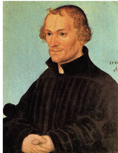
Philipp Melanchthon von Lucas Cranach d. Ä., 1532 in Regensburg

EKD übernommen. Unter anderem soll eine reformationsgeschichtliche Forschungsbibliothek sowie das Predigerseminar der UEK untergebracht werden. Das Augusteum wird nach dem Umzug des Predigerseminars der Stiftung Luthergedenkstätten übertragen. So bietet diese Umstrukturierung auch neue Möglichkeiten, Sonder- und Dauerausstellung in qualitativ hochwertiger Form auszurichten. Die rechtliche und tatsächliche Neuordnung der Verhältnisse zwi-