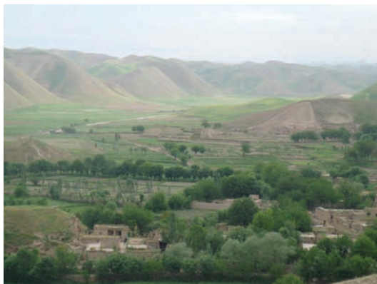
Landschaft im Nordwesten Afghanistans

eine begleitende nicht-militärische, politische und gesellschaftliche Strategie mit einer erkennbaren Erfolgsoption? Mit gewichtigen Gründen können diese Punkte beim Afghanistaninsatz bejaht werden. Als Christen wissen wir indes zusätzlich, dass wir sowohl durch Handeln als auch durch Unterlassen unter Umständen ausschließlich einer Option begegnen, die auch mit Schuld verbunden sein kann bzw. ist, eine Folge der Gebrochenheit und Fehlerhaf-