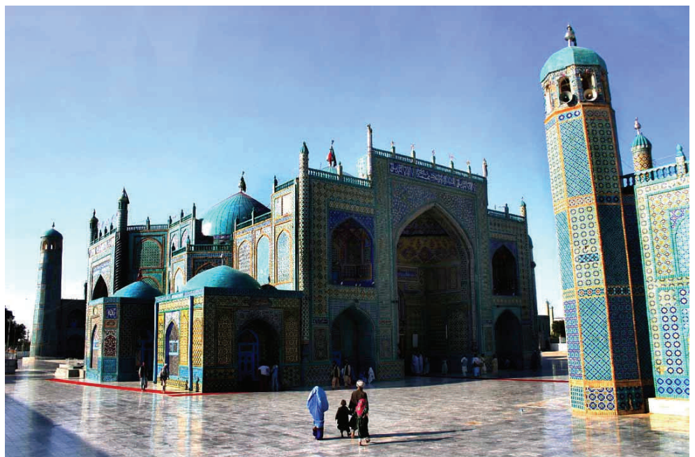
Das Ali-Mausoleum in Mazar-e-Scharif ist die bedeutendste Wallfahrtsstätte Afghanistans

Kirche, unsere Kirche, ersetzt mit ihren Positionen und Wegweisungen keine politischen Entscheidungen.