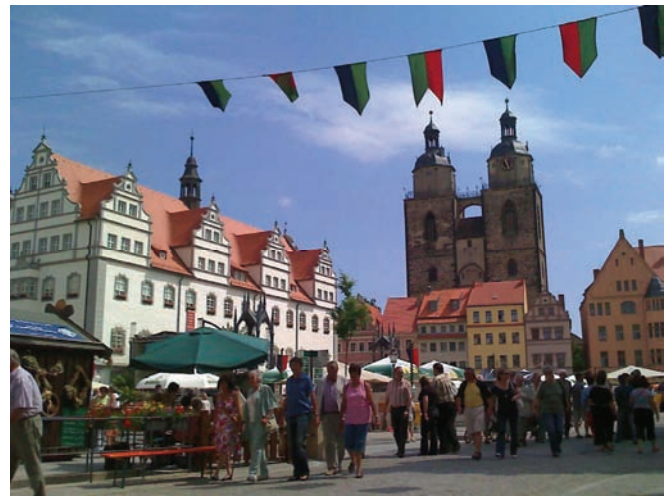
Stadtfest in Wittenberg