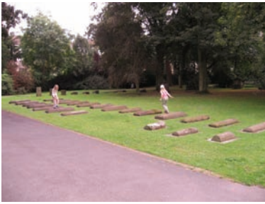
Kindliche Unbefangenheit beim Umgang mit dem Thema Tod

Schmerzfreiheit am Lebensende – was ist aus ärztlicher Sicht medizinisch und ethisch möglich?