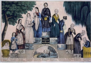
Stationen des Lebens, Wandbilddruck aus dem 19. Jahrhundert