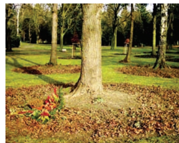
Baumfeld auf einem Friedhof