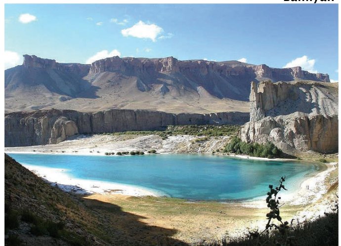
Band-e-Amir-Seen bei Bamiyan

Auslandseinsätze der Bundeswehr sind nicht vollständig neu, in Afghanistan haben sie aber eine neue Qualität erhalten, an der wiederum eben auch die christliche Verantwortung reflektiert werden kann.