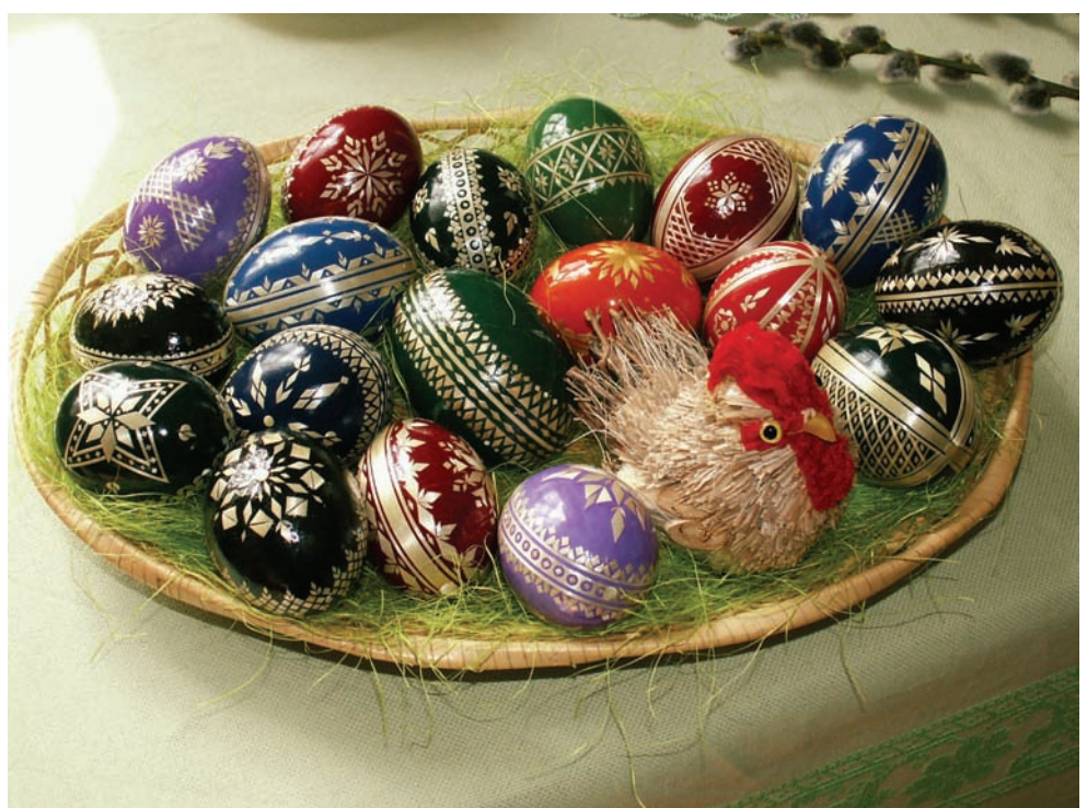
Ostereier aus Tschechien

Zu Ostern feiern wir Jesus, den Sieger über den Tod.