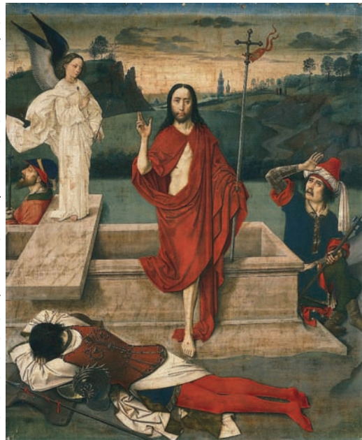
Auferstehung - Dieric Bouts 1455

Am Ostermorgen treffen sich immer wieder Christen ganz früh am Morgen auf einem Friedhof zu einer Morgenandacht. Mitunter ist es noch empfindlich kalt. Singend wird der angehende Tag begrüßt. Das gemeinsame Tun erinnert an die Erlebnisse der Jünger in Jerusalem, die nach Jesu Tod und Begräbnis verzweifelt auf ein Gotteszeichen hofften. Alle ihre Zielvorstellungen von Gottes Reich auf dieser Erde sind mit dem Tod von Jesus Christus zerbrochen. Für sie so endgültig und nicht mehr änderbar.